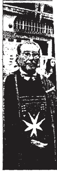
L'investitura di Cesare